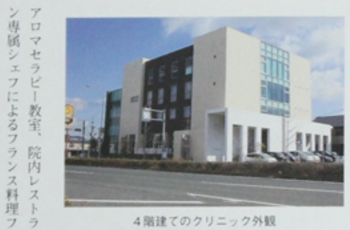
4階建てのクリニック外観

アロマセラピー教室、院内レストラ専用シェフによるフランス料理ブルコースのお祝い膳、エステティックサービス、満一歳お誕生日会、赤ちゃんのおててを使ったコミュニティワークショップ育児法を学ぶなど工夫されている。